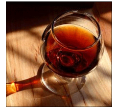
Vino o Porto

Para un final celestial, saborear los dulces preparados en los conventos “toucinho do céu”, “barrigas de freiras” o “orelhas de abade”.