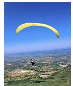
Linhares de Beira en Beiras