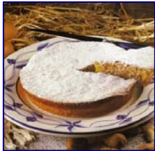
Toucinho do céu