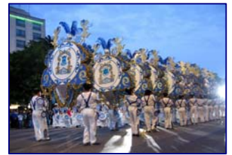
Fiesta San Antonio