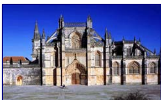
Monasterio de Batalha