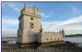
Torre de Belem