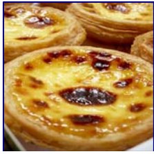
Pasteles de Nata