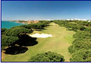
Campo de golf Pine Cliffs

Darse un baño de espuma en uno de los clubs de Algarve en verano.