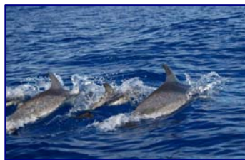
Delfines en el océano Atlántico cerca de la isla Faial en la Azores.