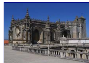
Convento de Cristo en Tomar