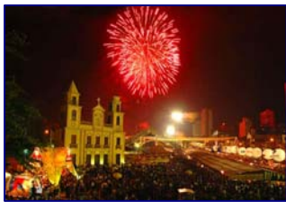
Fiesta de Sao Joao en Oporto

Los portugueses son famosos por tomarse la vida con calma pero eso no quiere decir que no sepan pasarlo bien. Se pueden encontrar bares y lugares de diversión nocturna incluso en las ciudades más pequeñas y en las ciudades más grandes es posible bailar toda noche en algunas de las discotecas más sofisticadas de Europa. Si no le gustan los clubs, durante todo el año se celebran festivales internacionales de jazz, baile, música clásica, folklore y, por supuesto, fados. En lo que respecta al deporte, Portugal es el lugar ideal para practicar deportes acuáticos de talla mundial, desde vela a Windsurf y desde pesca a buceo. También se pueden practicar otros deportes como montar los famosos caballos lusitanos de pura sangre. Pero la verdadera pasión de muchas de las personas que visitan Portugal es el golf. Las instalaciones de golf de nivel internacional responden a las necesidades de todo tipo de jugadores, desde novatos hasta profesionales.