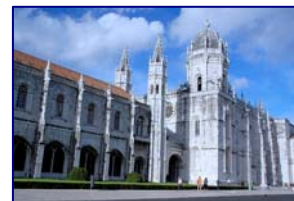
Monasterio de los Jerónimos